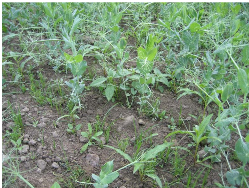
Etablering av engsvingel i ertre.

Utarbeidet av Vestfold Bondelag i samarbeid med Bioforsk Øst og Forsøksringen Fabio Tekst: Trygve Aamlid og Kari Bysveen